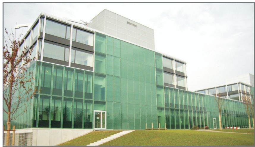
Grossauftrag: das neue Spital in Baar

«Ich durfte Hanspeter Hefti vor 15 Jahren den ersten Auftrag für Arondo im Glarner Hinterland erteilen – und seither arbeiten wir ohne Unterbruch zur vollsten Zufriedenheit zusammen. Das sagt doch alles, oder?»