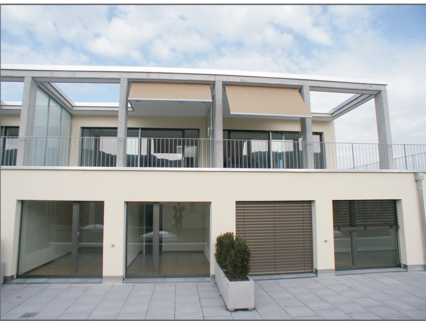
Aktuell: das neue Obersee Center in Lachen

«Wie heisst der Slogan von Arondo? Damit alles rund läuft... Genau deswegen arbeiten wir am liebsten mit dieser Firma zusammen. Nicht wegen des Slogans, sondern weil wirklich immer alles rund läuft.»