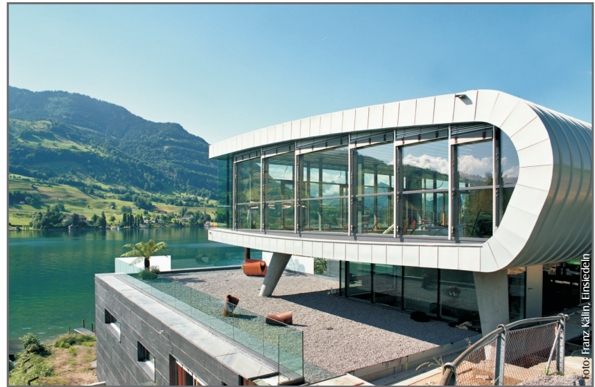
Exklusivität in Küsnach von Marty Architektur, Schwyz